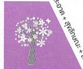
กายภาพ + สิ่งแวดล้อม+บรรยากาศ

แผนพัฒนาเศรษฐกิจและสังคมแห่งชาติ ฉบับที่ ๙ - ๑๑