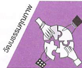
ธรรมาภิบาล